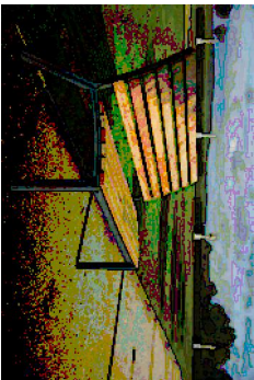
LAVIČKA PARKOVÁ "ALUMA bez opěky" - 11: STREETPARK Třebíč